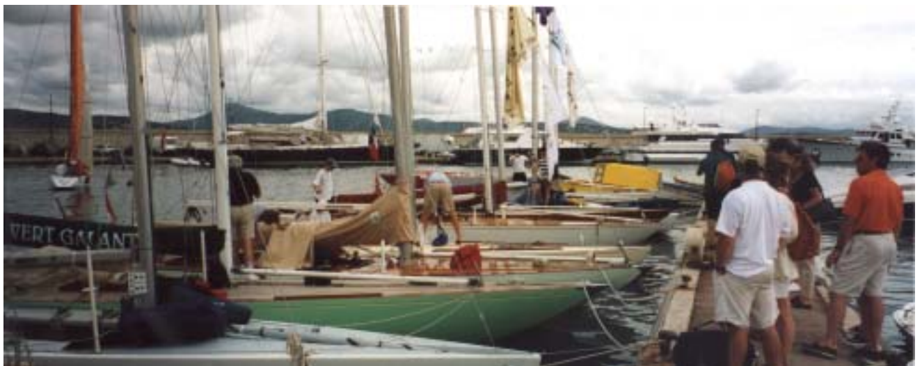
6mJI au ponton