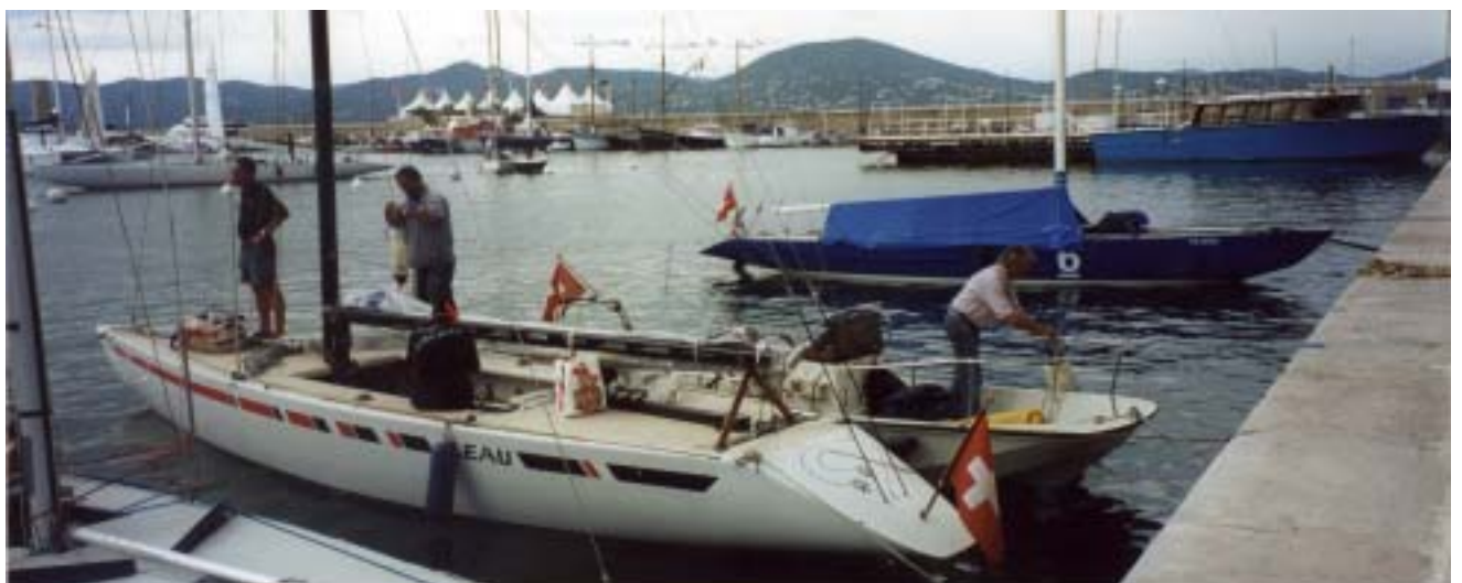
SUI 77 Le Champion d' Europe 2000