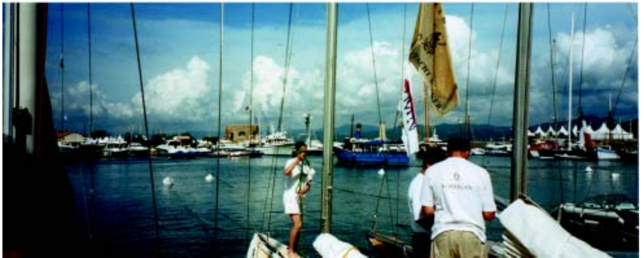
Korrigan SUI 40