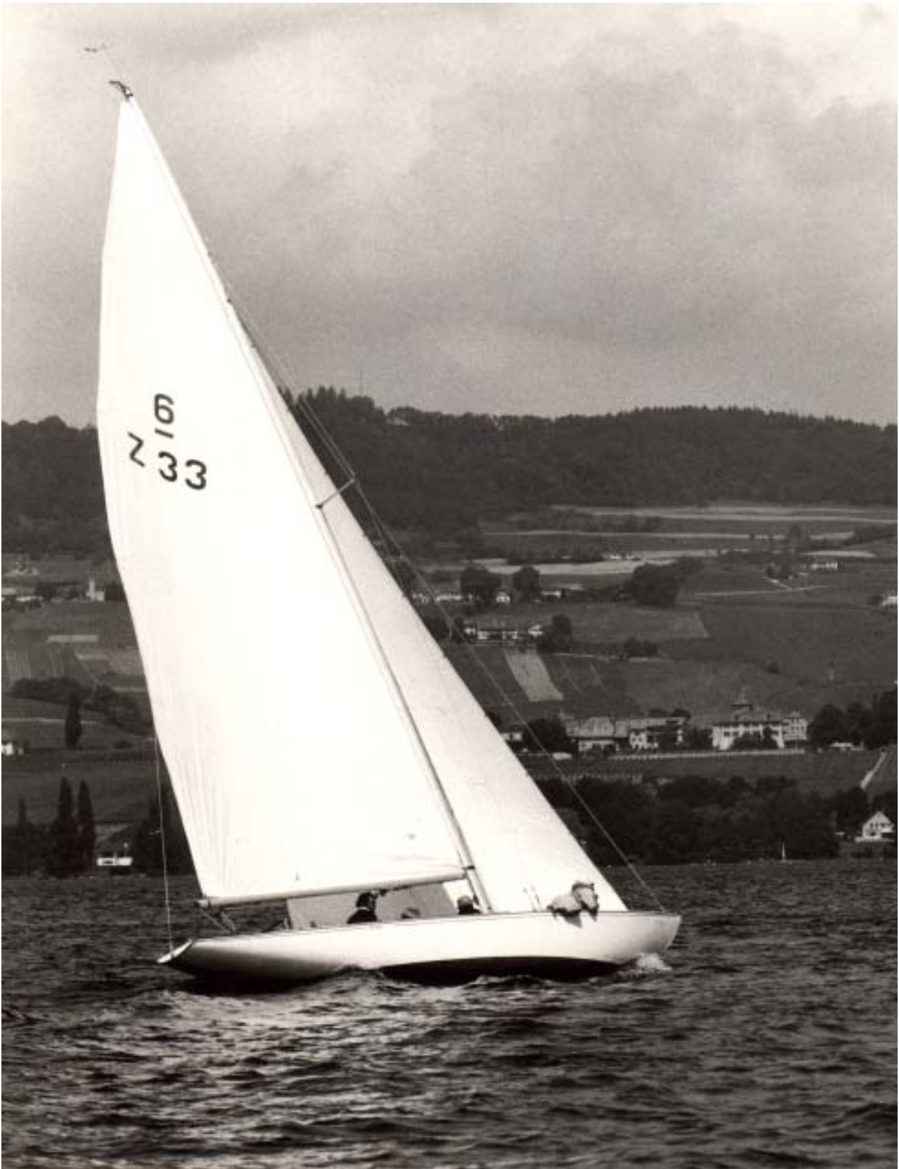
Bild 1973 vor Rolle